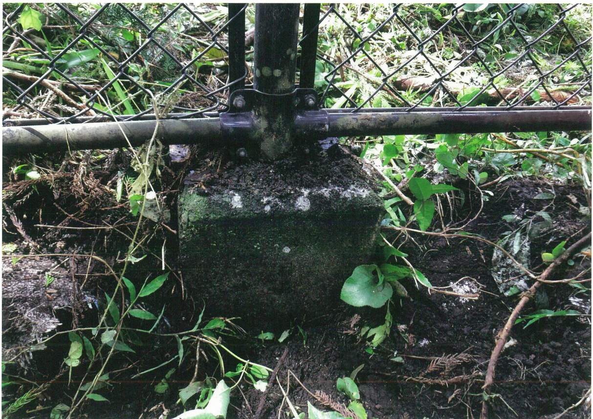
2 ③地点基礎工事前（東から）