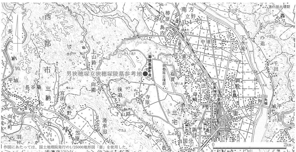
第1図 男狭穂塚女狭穂塚陵墓参考地 位置図 (1/50,000)

(1) 立会調査の実施にあたっては、宮崎県教育庁の甲斐貴充氏、宮崎県立西都原考古博物館の松林豊樹氏、元陵墓課職員の福尾正彦氏よりご助言を頂いた。記して感謝申し上げます。