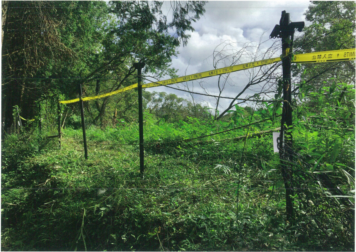
1 ③地点工事前（北東から）