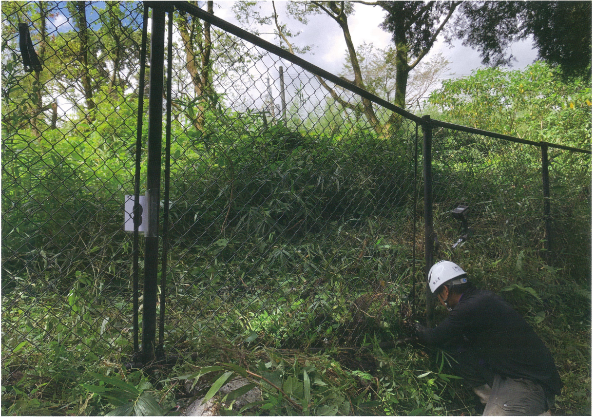
1 ③地点工事中（南東から）