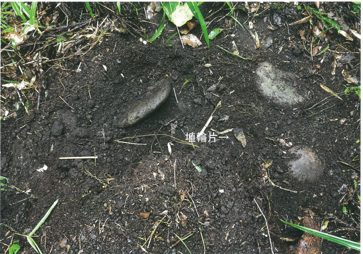
2 女狭穂塚東造出（東から）