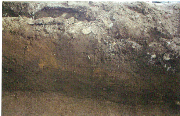
2 東壁 鬼界アカホヤ火山灰層（西から）