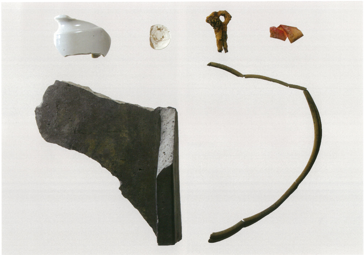
2 柱痕1埋土中から出土した遺物