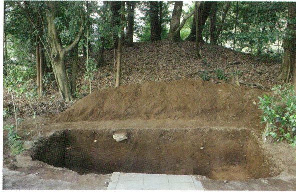
1 トレンチ全景（東から）