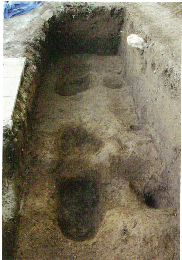
3 トレンチ全景（北から）