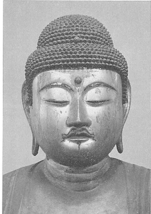
第2図 阿弥陀如来像の面相部（左・近衛天皇陵安置、右・安楽寿院蔵）