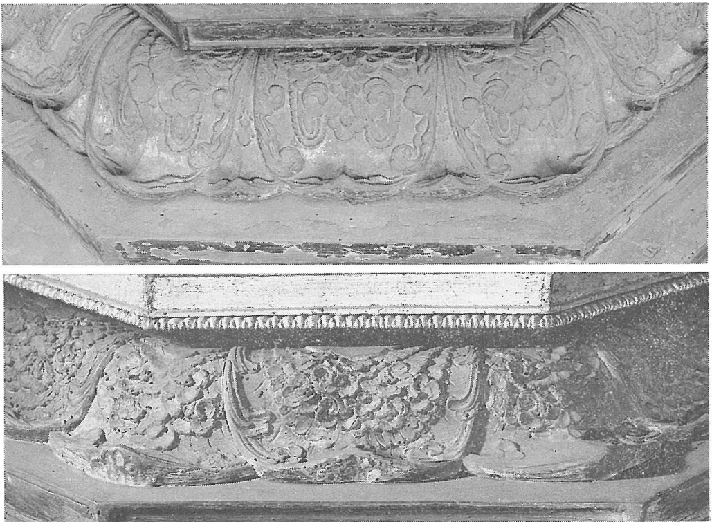
第4図 台座反花の文様（上・近衛天皇陵像、下・安楽寿院像）